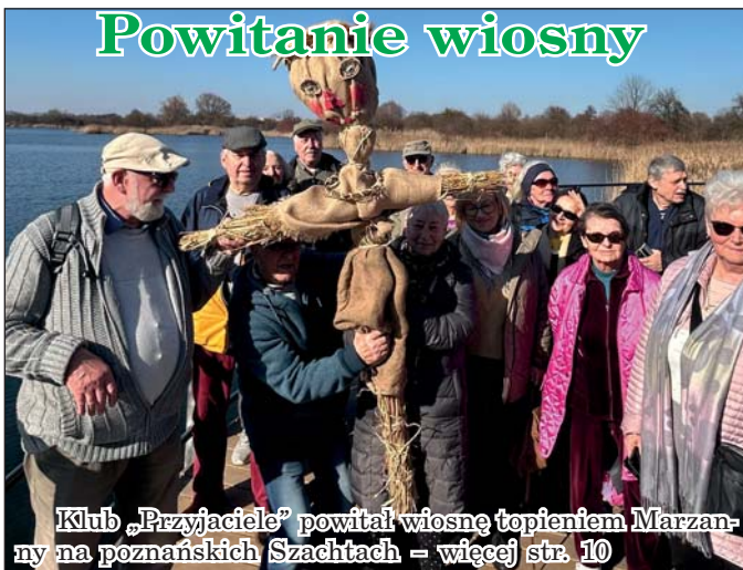
Klub „Przyjaciele” powitał wiosnę topieniem Marzanny na poznańskich Szachtach – więcej str. 10

Radosnych Świąt Wielkanocnych zdrowia, szczęścia i wszelkiej pomyślności