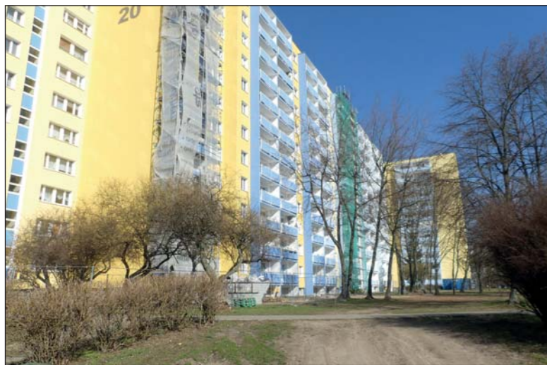
Postępuje modernizacja balkonów wieżowca nr 20

Pierwszym królem Polski, koronowanym w roku pańskim 1025 był Bolesław Chrobry i on też patronuje pierwszemu spółdzielczemu osiedlu mieszkaniowemu na Piątkowie. W latach siedemdziesiątych ubiegłego wieku na terenach tej podpoznańskiej wsi, pośród pól zaczęto z rozmachem stawiać bloki z wielkiej płyty, a pierwszym oddanym do zamieszkania budynkiem była obecna 14.