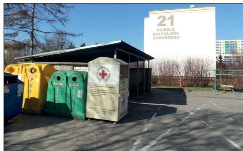
Tradycyjna altanek na odpady zastąpią wkrótce podziemne zbiorniki

Osiedle, na którym znajduje się kilkanaście wieżowców jest piątkowskim liderem w sięganiu po odnawialne źródła energii. Niebawem na sześciu kolejnych budynkach 25, 26, 27, 37, 38 i 39 zainstalowane zostaną panele fotowoltaiczne. Pozyskiwany przez nie prąd będzie wykorzystywany głównie przez dźwigi osobowe, których praca jest energochłonna. Takie rozwiązanie przynosi spore oszczędności. Montaż instalacji wymaga przygotowania