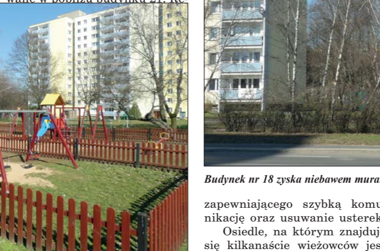
Budynek nr 18 zyska niebawem mural oraz zmodernizowane windy

nież przygotowania do budowy pierwszych na osiedlu podziemnych zbiorników na odpady. Dobrze sprawdzają się one na innych piątkowskich osiedlach. Wkrótce kolorowe i estetyczne urządzenia zostaną zainstalowane w pobliżu budynku 21. Re-