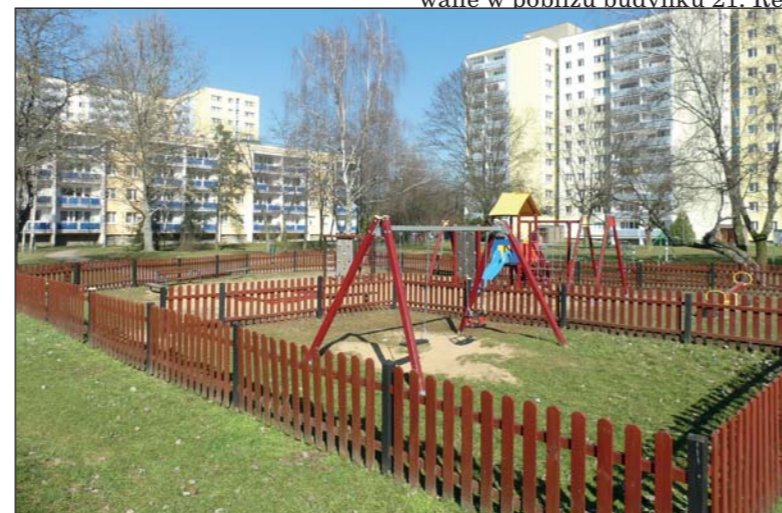
Przed wiosną warto zadbać o place zabaw i urządzenia sportowe

i zwykłymi mieszkańcami. Rozmowy prowadzę nie tylko na dyżurach ale też podczas moich wędrówek po osiedlu. Zaglądam tu i tam, pytam, słucham i szukam rozwiązań. Znaleźliśmy już sposób na pootwierane drzwi do altanek odpado-