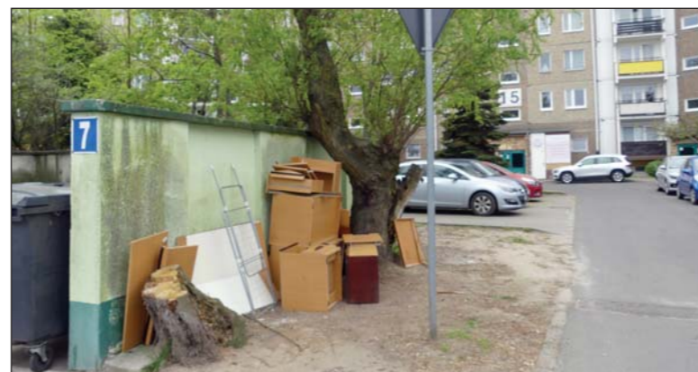
Przy budynku 15 nieco zdewastowane zasieki zastąpią wkrótce nowoczesne półpodziemne pojemniki na odpady

zachowania porządku wokół nich. Wkrótce rozpocznie się na osiedlu budowa trzeciego tego typu śmietnika. Zostanie on usytuowany przy budynku 15 i zastąpi nie-