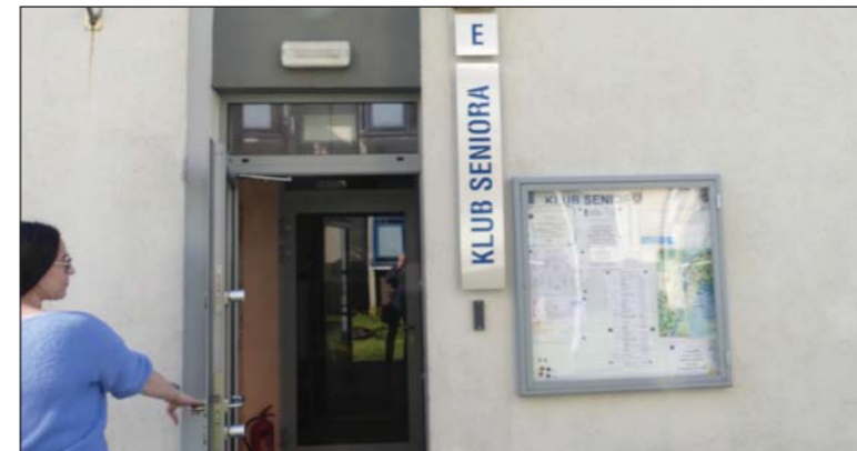
Osiedlowy klub zaprasza do wspólnych działań

Liczne propozycje na ciekawy i aktywny wypoczynek ma dla mieszkańców także osiedlowy klub „Batory”. Dzieje się w nim wiele o każdej porze roku. Podczas zajęć plastycznych powstają liczne dzieła i kompozycje, które ozdabiają klubowe pomieszczenia. Organizowane są też interesujące spotkania i wycieczki. Klub jest otwarty dla wszystkich mieszkańców i każdy powinien w nim znaleźć coś dla siebie. (i)