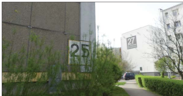
Blok 27 już po termomodernizacji, a sąsiedni budynek 25 jeszcze przed

przeciaga, ale niebawem powinien wejść w życie. A my jesteśmy w gotowości by niejako z marszu wystąpić z wnioskami o dofinansowanie. W obecnej sytuacji niepewności na rynku paliw i podwyżek cen energii termomodernizacje są koniecznością. Na naszym osiedlu trzeba je przeprowadzić jeszcze na 23 budynkach. Przygotowując się do tego zadania Zarząd PSM zlecił wykonanie dla wszystkich budynków audytów energetycznych – mówi