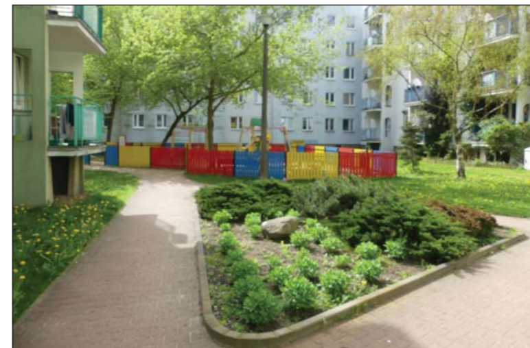
Plac zabaw i zadbane trawniki są ozdobą osiedla

ków dwóch kółek jest bowiem coraz więcej i niekiedy miewają oni trudności z zaparkowaniem jednoślada. Trudno im się jednak porównywać ze zmotoryzowanymi, którzy przeżywają prawdziwe problemy ze znalezieniem miejsca dla swych czterech kółek. Niestety, wieloletnie starania o urządzenie parkingu na miejskiej działce za kościołem nie znajdują przychylności magistratu. Miasto z działki nie korzysta, ale innym też nie pozwoli. W tym roku w wielu budynkach przeprowadzona zostanie również wymiana legalizacyjna wodomierzy i podzielników ciepła. Do wymiany jest około 3 000 tych urządzeń.