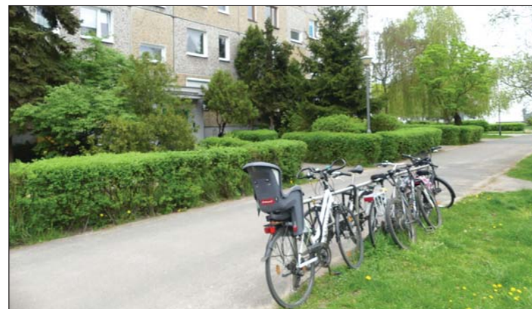
Parkowanie rowerów też bywa niekiedy utrudnione

W budynkach i alejkach pomiędzy nimi prowadzonych jest sporo bieżących napraw i niewielkich remontów. W ich ramach przybywa też estetycznych ławek oraz stojaków na rowery. Miłośni-