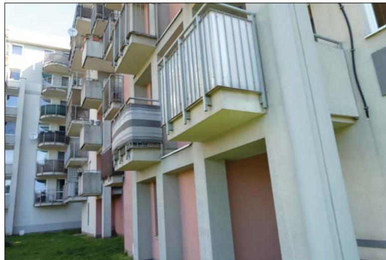
Fasada budynku 31, na którym od niedawna działa instalacja fotowoltaiczna

Jasne, odnowione elewacje budynków 26, 27 i 28 na os. Stefana Batorego oraz zadbane teren między nimi są najlepszą zachętą do przeprowadzenia termomodernizacji kolejnych bloków.