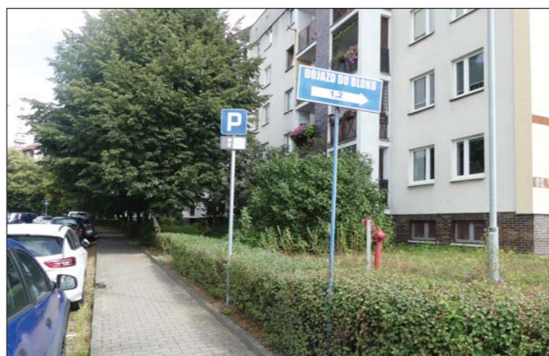
Zmiany związane z wprowadzaniem strefy organizacji ruchu

Obecnie niezbędne są więc coraz liczniejsze naprawy i modernizacje. Choć przedsięwzięcia remontowe ograniczane są skromnymi możliwościami finansowymi, to prowadzi się ich całkiem sporo. Do najważniejszych należy wyremontowanie dachów bloku nr 4 na os. Zygmunta Starego oraz nr 27 na os. Władysława Jagiełły. Kontynuowane jest odnawianie elewacji kolejnej ściany budynku 12 D na os. Zygmunta Starego połączone z myciem i malowaniem specjalnymi farbami odpornymi na aurę i porost alg. Remontowane są obecnie balkony budynku 10 A i B na os. Władysława Jagiełły. W ramach