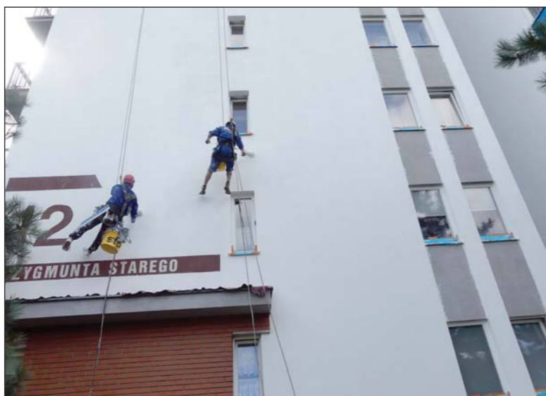
Malowanie ścian wysokich budynków wymaga alpinistycznych umiejętności

- Przygotowanie dokumentacji, przeprowadzenie uzgodnień oraz zamontowanie oznakowania wymagało sporego wysiłku organizacyjnego. Tym bardziej, że strefa obejmuje także odcinki ulic należących do miasta oraz starano się by ograniczyć w niej liczbę wymaganych znaków i nie stawiać ich ponad niezbędną potrzebę. Działania przebiegły pomyślnie i niebawem SOR obejmie znaczną część Piątkowa. Strefa obowiązywać będzie bowiem na trzech sąsiadujących ze sobą osiedlach Bolesława Chrobrego, Władysława Jagiełły i Zygmunta Starego. Jednolite oznakowanie i obowiązujące w niej jasne zasady ruchu oraz parkowania powinny poprawić bezpieczeństwo oraz umożliwić, we współpracy z Poli-