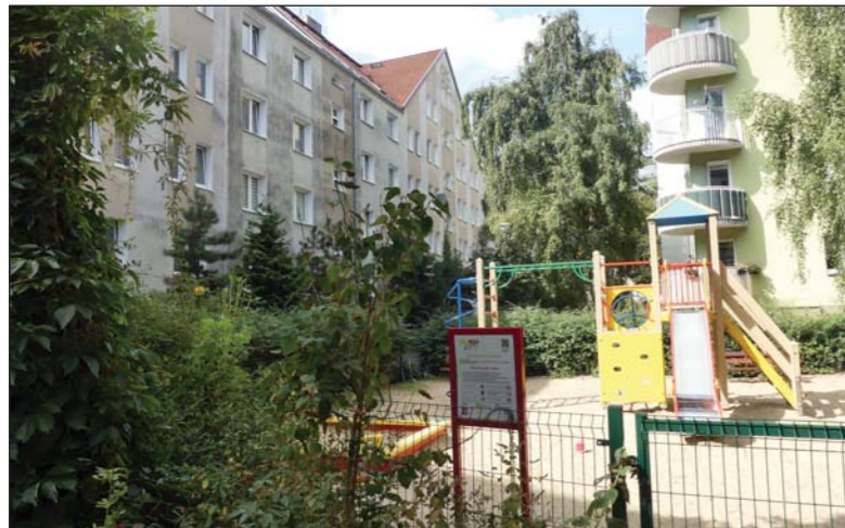
Zielone zakątki i kolorowe balkony wymagają wielu zabiegów pielęgnacyjnych

Dobiegają końca prace związane z wyznaczeniem i oznakowaniem stref organizacji ruchu mających zwiększyć bezpieczeństwo i ułatwić życie zmotoryzowanym oraz pieszym. Od kilku tygodni funkcjonuje już SOR na os. Zygmunta Starego, a we wrześniu obejmie ona także os. Władysława Jagiełły.