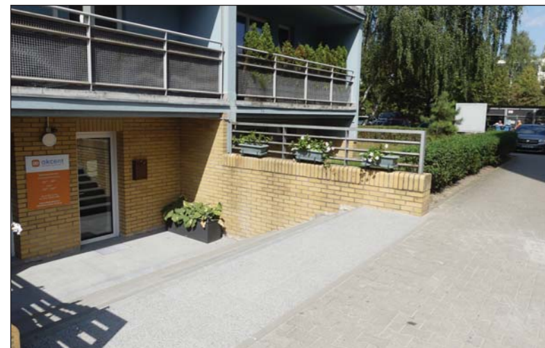
Odnowione wejście jest wygodniejsze i bezpieczniejsze

A zainteresowanie przyrodą wśród mieszkańców jest duże. Potwierdza to ich bardzo liczny