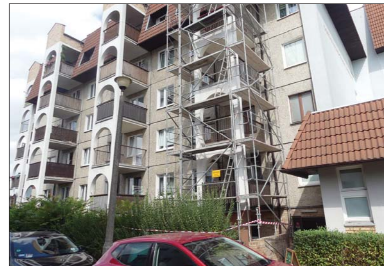
Rusztowania są zapowiedzią modernizacji balkonów

leżytym stanie budynków prac prowadzonych jest wiele. Wkrótce rozpoczną się modernizacje