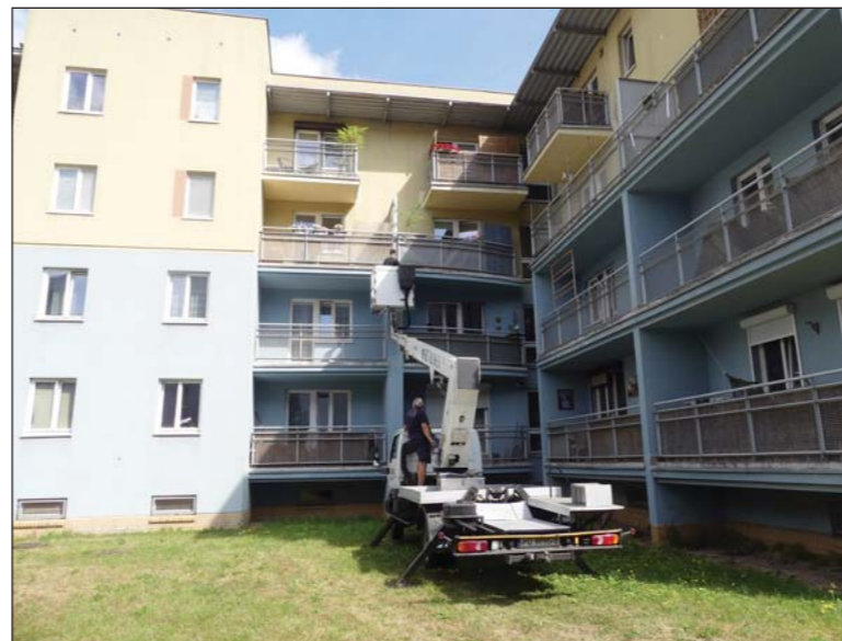
Specjalistyczny sprzęt jest nieodzowny podczas napraw na wysokościach

Z motoryzacyjnymi przekształceniami wiązać się także zmiany w funkcjonowaniu dwóch osiedlowych parkingów położonych na obu osiedlach. Od września zarządzanie nimi przejmie i będzie je prowadzić bezpośrednio osiedlowa Administracja. Takie rozwiązanie powinno zwiększyć wpływy finansowe, które przeznaczone będą na remonty. A potrzeby w tym zakresie są duże, upływ czasu daje się bowiem we znaki kilkudziesięcioletnim już budynkom, które wznoszone były w okresie przemian ustrojowych gdy z technologiami oraz jakością prac bywało różnie.